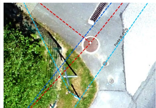
D'autres possibilités : contrôle de qualité des données SIG