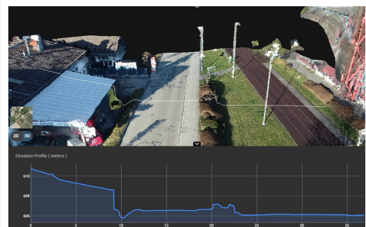
Des outils et de mesure de profils simples